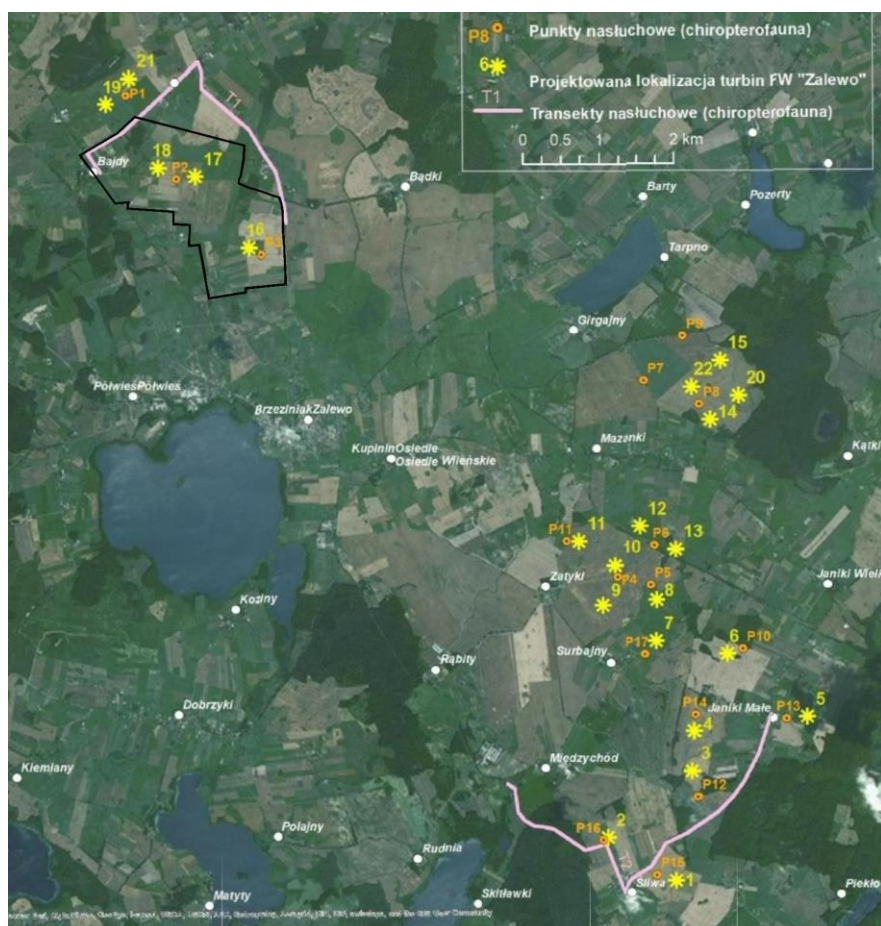
Rys. 2. Lokalizacja punktów nasłuchowych i przebieg transektów chiropterologicznych na tle form użytkowania terenu (ortofotomapa) oraz planowanych miejsc posadowienia turbin; czarną linią oznaczono granice przedmiotowego projektu planu.

W obrębie transektów prowadzone zostały nasłuchy detektorem ultradźwiękowym LunaBat DFD-1. Wyniki zapisywane były na rejestratorze ZOOM H-1. Uzyskane wyniki były analizowane za pomocą programu Cool Edit Pro i Reaper (postprocessing sygnałów). Nasłuchy na transektach polegały na przemarszu wyznaczonej trasy z przystankami w wyznaczonych punktach nasłuchowych. Pomiary mogły zaczynać się ok. poł godziny po zachodzie słońca i trwać nie dłużej niż cztery godziny od rozpoczęcia kontroli (nie dotyczyło to kontroli całonocnych). Nagrania w punktach nasłuchowych trwały nie mniej niż 15 min. Detektor umieszczany był ok 1,5 m nad ziemią a mikrofon kierowany był ok 45° ku górze. Rejestrowane były zarówno słyszane jak i widziane nietoperze.