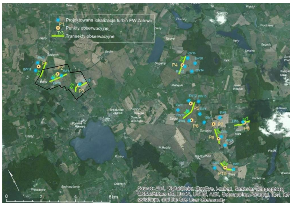
Rys. 1. Lokalizacja punktów obserwacyjnych i przebieg transektów na tle form użytkowania terenu (ortofotomapa) oraz planowanych miejsc posadowienia turbin; czarną linią oznaczono granice przedmiotowego projektu planu.

Na terenie objętym granicami opracowania projektu planu oraz w jego otoczeniu wykonano wstępny monitoring ornitologiczny, który objął teren planowanej farmy wiatrowej „Zalewo” (rys. 1).