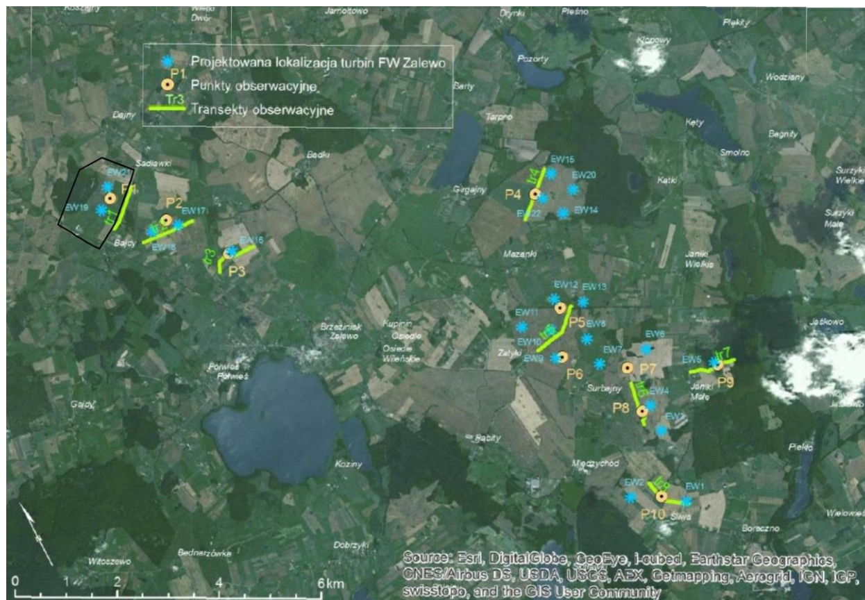
Rys. 1. Lokalizacja punktów obserwacyjnych i przebieg transektów na tle form użytkowania terenu (ortofotomapa) oraz planowanych miejsc posadowienia turbin; czarną linią oznaczono granice przedmiotowego projektu planu.

Na terenie objętym granicami opracowania projektu planu oraz w jego otoczeniu wykonano wstępny monitoring ornitologiczny, który objął teren planowanej farmy wiatrowej „Zalewo” (rys. 1).