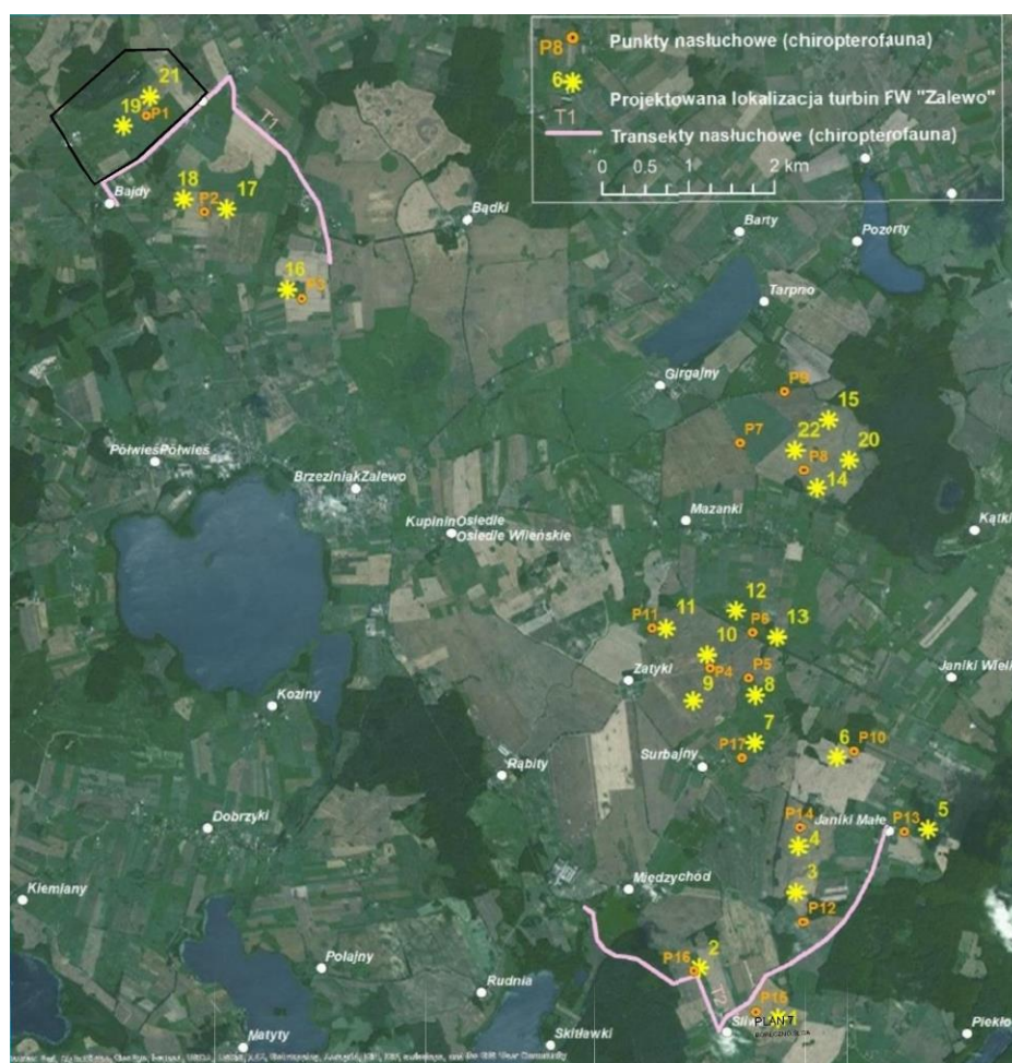
Rys. 2. Lokalizacja punktów nasłuchowych i przebieg transektów chiropterologicznych na tle form użytkowania terenu (ortofotomapa) oraz planowanych miejsc posadowienia turbin; czarną linią oznaczono granice przedmiotowego projektu planu. (źródło: Raport (...), 3GSC, 2014 ).

W zależności od wyróżnionych fenologicznych okresów aktywności u nietoperzy, przeprowadzono kontrole według schematu przedstawionego w tabeli 2.